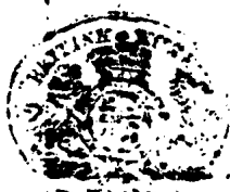
صورة الورقة ١ / أمن المخطوط